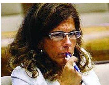
La presidente di Confindustria Emma Marcegaglia

Accordo, è stato ribadito nella segreteria della Cgil, che è stato considerato negativamente da Corso d'Italia. Di certo questo complica i rapporti ed il percorso. Rapporti che saranno valutati proprio alla vigilia del nuovo incontro sui contratti di giovedì. Per mercoledì sono infatti convocate le segreterie unitarie Cgil, Cisl e Uil. Il confronto sarà certamente ampio, dalla manovra, che lascia aperta la questione degli statali, alla politica economica in generale, sino ai contratti, appunto, sia per quanto riguarda il prosieguo del confronto con gli industriali sul rinnovo degli assetti contrattuali sia per quanto riguarda l'intesa sul terziario. Sta di fatto che la Cgil, ribadendo che le posizioni con Confindustria restano distanti sulla questione dell'indice inflazionistico ma anche sul primo livello di contrattazione, torna ad indicare come prioritario il recupero del potere d'acquisto.